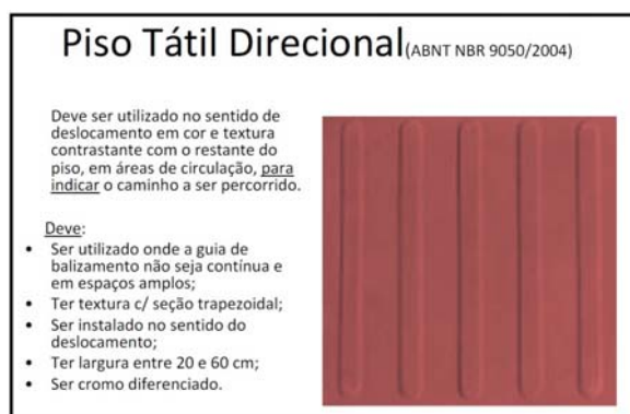
Figura 03 – Piso tátil direcional

Os locais e os padrões de assentamento do piso estão relacionados no projeto.