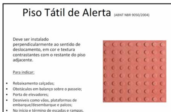
Figura 04 – Piso tátil alerta